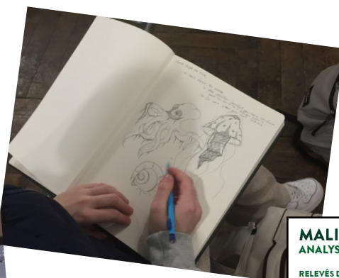
Croquis réalisés lors d'une sortie pédagogique : rencontre avec l'illustratrice