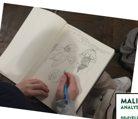
Croquis réalisés lors d'une sortie pédagogique : rencontre avec l'illustratrice

Salle de classe : apprentissage des logiciels de la suite Adobe